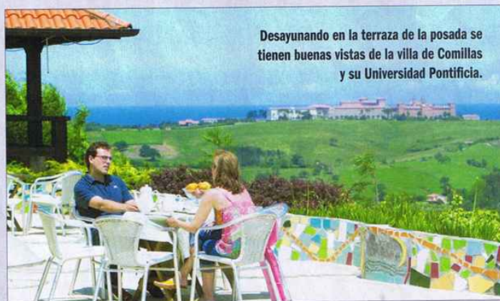
Desayunando en la terraza de la posada se tienen buenas vistas de la villa de Comillas y su Universidad Pontificia.

Además, como la posada está estratégicamente situada, en su entorno más cercano, encontramos una gama de lugares de visita casi obligatoria: Comillas con los emblemáticos edificios de El Capricho de Gaudí, la Universidad Pontificia o el Palacio de Sobrellano, y un casco antiguo precioso; y Santillana del Mar , una villa medieval